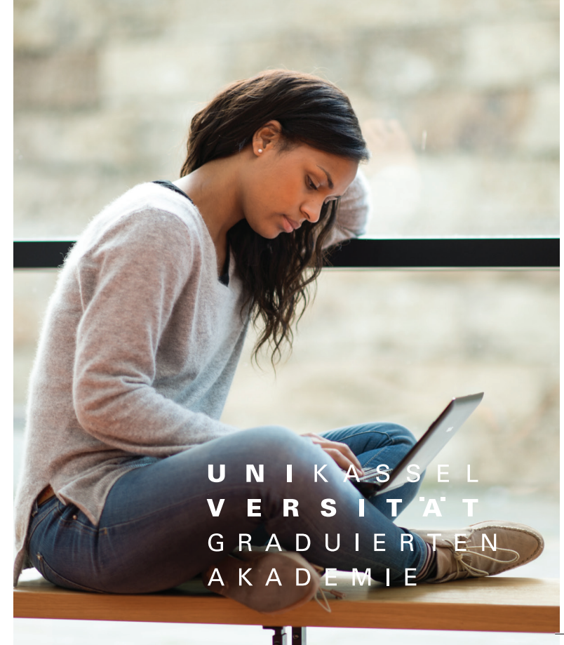
Gestaltung: Universität Kassel: Gianna Dalfuß / Monique Kuhlentkamp, Fotos: Universität Kassel / Studio Blofield